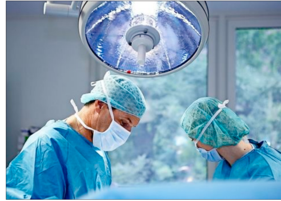
Eine OP wird nur dann durchgeführt, wenn die konservativen Möglichkeiten ausgeschöpft sind.