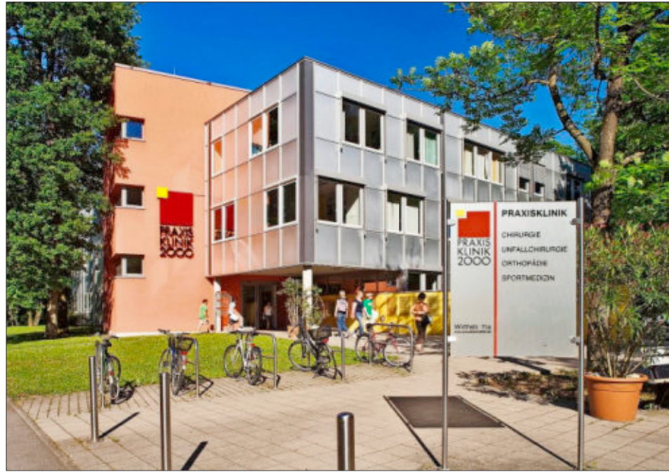
Markanter Bau an der Wirthstraße: die Praxisklinik 2000.