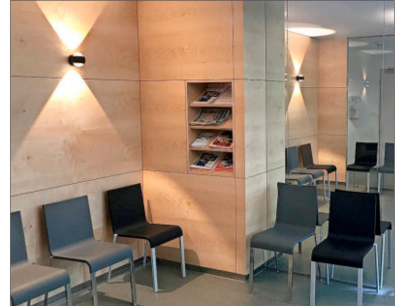
Auch der Wartebereich wurde komplett neu gestaltet.