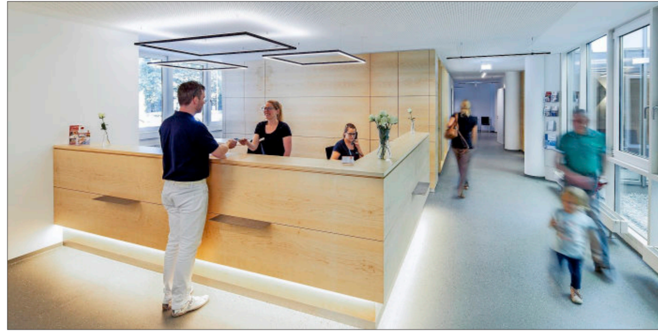
Der vom Schreiner gestaltete Empfangsbereich besticht durch sein individuelles Beleuchtungskonzept.